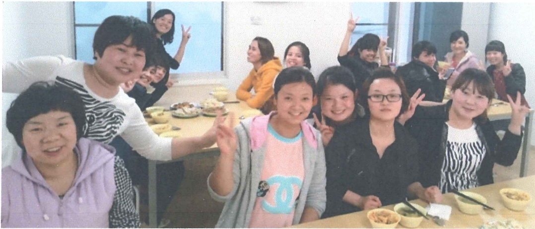
中国とベトナムの実習生はみんな一緒に作って、食べて、楽しかった!