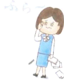
ふらふら (头昏沉、头晕)