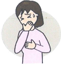
むかむか (反胃、悪心)