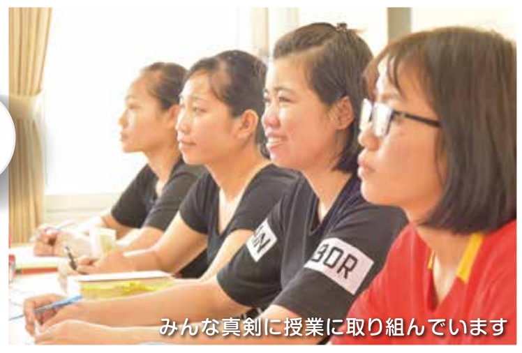
みんな真剣に授業に取り組んでいます