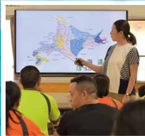
▲先生と一緒に地図で海事協の場所を確認