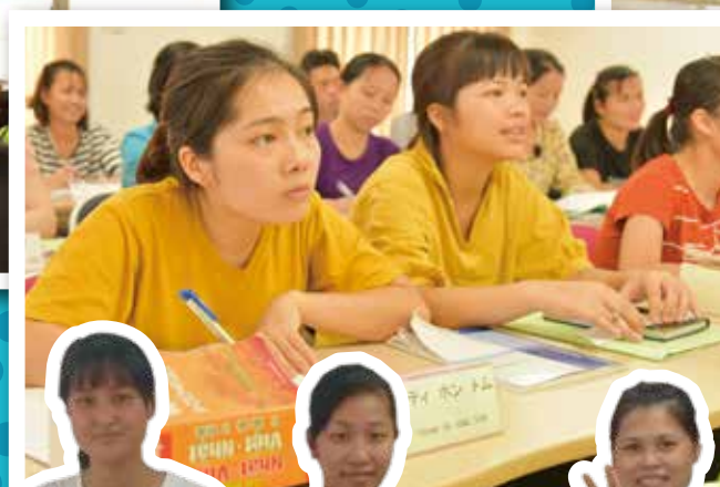
一番最初に習うのは挨拶の仕方です