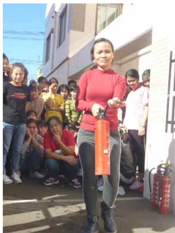
▲実際に消火器を使用した訓練の様子。火元を消火出来るようしっかり練習します。